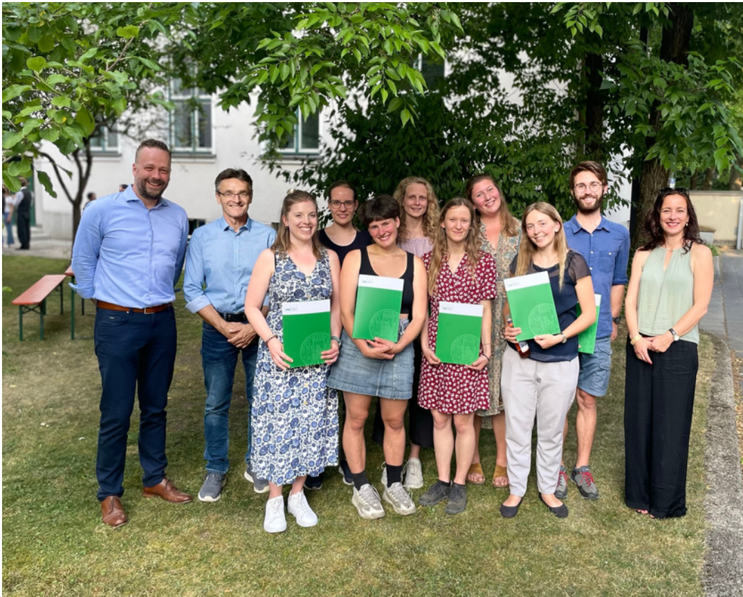
Zweiter Abschlussjahrgang des el mundo - Zertifikatsstudiums

Am 29.06.2023 durften wir mit einer Abschlussfeier den zweiten el mundo - Jahrgang, der im Wintersemester 2020/21 das Zertifikatsstudium aufgenommen hatte und dieses im Frühjahr 2023 erfolgreich abschlossen hat, verabschieden. Wir wünschen euch viel Erfolg auf eurem weiteren Weg und danken euch für die gemeinsame Zeit!