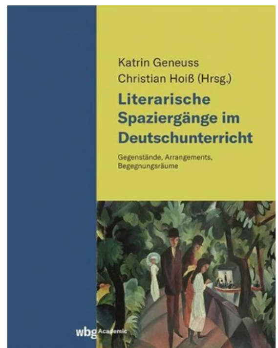
“Literarische Spaziergänge im Deutschunterricht” ©wbg Academic

Die in diesem Band zusammengetragenen Beispiele zeigen, dass die Spaziergänge sowohl in der schulischen wie in der außerschulischen Bildung für verschiedene Zielgruppen einsetzbar sind. Die Lektüre dieses frisch erschienenen Bandes bietet einen Blick auf das Spektrum der Möglichkeiten.