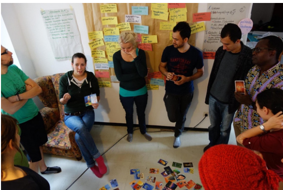
Zukunftswerkstatt mit Commitler:innen

Commit lädt Aktive, Mitglieder, Netzwerkpartner:innen und Interessierte, die sich einbringen möchten, gemeinsam Ziele und Projektideen für das Jahr 2024 zu erarbeiten zur Zukunftswerkstatt ein. Anschließend gibt es ein Neujahrsfest.