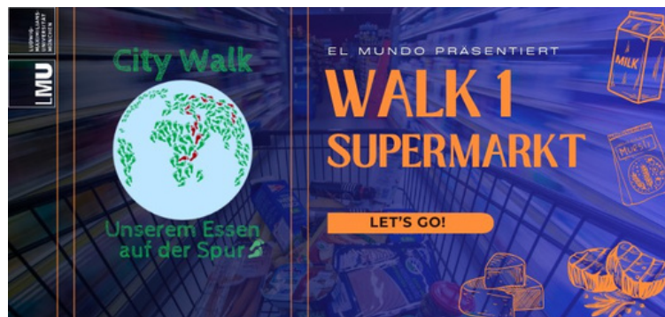
Logo City Walk 1 ©el mundo

Die entstandenen Fortbildungsmodule werden nach mehreren Evaluationsrunden auf verschiedenen Portalen für interessierte Lehrpersonen bereitgestellt. Wir halten Sie auf dem Laufenden!