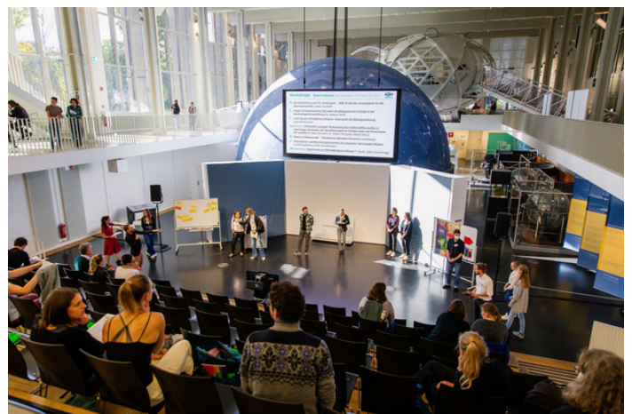
CDR Konferenz

Die bundesweite Bildungskonferenz zum Thema CO 2 -Entnahme aus der Atmosphäre brachte Wissenschaftler:innen und Didaktiker:innen zusammen, um gemeinsam die Klimabildung in den Schulen zu fokussieren. Auf der Konferenz plädierten Schüler:innenvertreterinnen des Schülerstadtrats München dafür, Themen der Nachhaltigkeit bereits ab den frühen Grundschuljahren zu behandeln und nicht erst in der Oberstufe. Studierende des el mundo Programms hoben die Notwendigkeit gemeinsamen Handelns hervor und bezogen das Publikum in dringliche Fragestellungen ein, wie z.B. „Wie kann man komplexe Themen der Nachhaltigkeit didaktisch reduzieren?“ Die Materialien zu CDR-Methoden sowie der Referent:innen finden Sie hier .