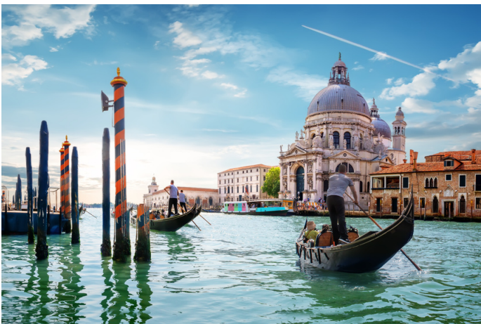
Grand Canal Venice

Des Weiteren fahren wir nach Venedig , um die Architekturbiennale zu erkunden, die unter dem Motto „The Laboratory of the Future“ steht. Was das mit Schulunterricht aller Fächer und Jahrgangsstufen zu tun hat? Die el mundo Studierenden stellen sich der Herausforderung zu erarbeiten, wie sich das große Thema „Leben, Wohnen, Bauen“ in ihren jeweiligen Fachunterricht integrieren lässt.