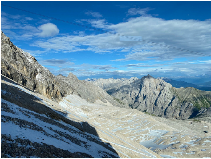
Blick ins Reintal

Exkursionen sind eine vortreffliche Möglichkeit, erfahrungsbasiert zu lernen und neue Inhalte an unbekannte Umgebungen zu knüpfen. Im el mundo Zertifikatsprogramm machen wir uns noch dieses Jahr auf den Weg auf die Zugspitze , wo wir eine Zukunftswerkstatt abhalten werden, um Leitbilder BNE-tauglicher Schule der Zukunft zu erarbeiten.